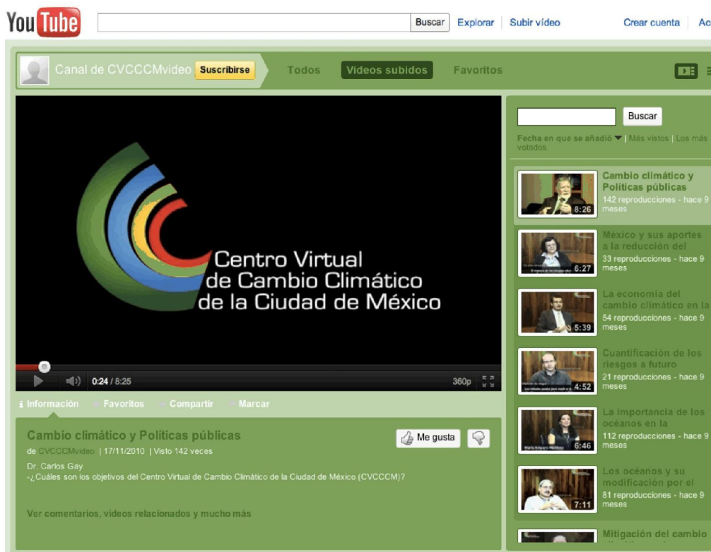
Figura 4: El canal YouTube de CVCCCM

YouTube: CVCCCM cuenta con un canal en YouTube (Figura 4) ( www.youtube.com/user/CVCCCMvideo#p/u ) con once videos, que se abrió en noviembre de 2010 y para fines de 2011, había recibido más de 2,000 visitas. La mayor parte de los contenidos consiste en entrevistas a investigadores del CVCCCM sobre temas relacionados con el cambio climático en Ciudad de México; por ejemplo: riesgos futuros, la vulnerabilidad de las zonas pobres, la mitigación en la industria y el comercio, los efectos del cambio climático en la vegetación, la relación entre el cambio climático y la contaminación del aire, y el cambio climático y las políticas públicas.