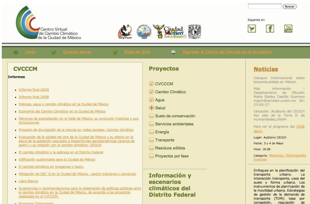
Figura 3: Página Web del CVCCCM

Sitio en Internet: La página web www.cycccm-atmosfera.unam.mx/cvcccm/ (ver Figura 3) se lanzó en agosto de 2008, inicialmente con aportes del Centro de Ciencias de la Atmósfera de la Universidad Nacional Autónoma de México (UNAM): bases de datos y escenarios climáticos con sus mapeos correspondientes. El sitio brinda información en español acerca de estudios de investigación e informes sobre seminarios y talleres, además de noticias, videos y mapas con modelos científicos de temperatura y precipitaciones. A fines de 2011, la página había recibido algo más de 43.000 visitas desde 2008; un promedio de entre 12 y 15 por día. El 91% de las visitas provenía desde el interior de México, el 3% de Estados Unidos y las restantes de otros países latinoamericanos (Y. Puente, comunicación personal, 2011).